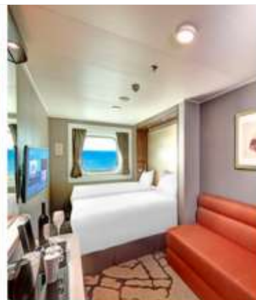
Oceanview Stateroom with Window