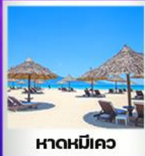
หาดหมีคว