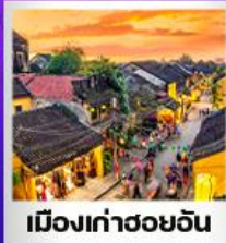
เมืองเก่าฮอยอัน