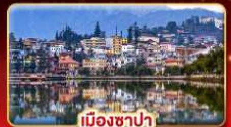
เมืองซาปา