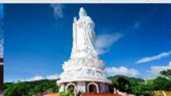
วันสันหื่อง