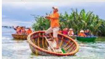
เรือกระดัง