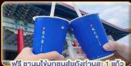
ฟรี ชานมไข่มุกชงสดถึงท่านละ 1 แก้ว