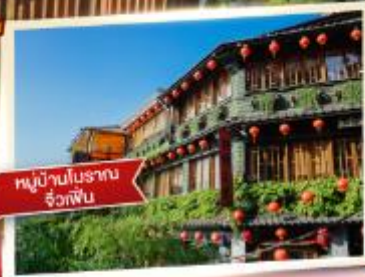
หมู่บ้านโบราณ จื่อกัฟิน