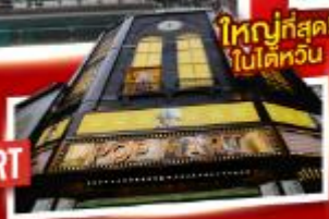
ใหญ่ที่สุด! ไปไต้หวัน