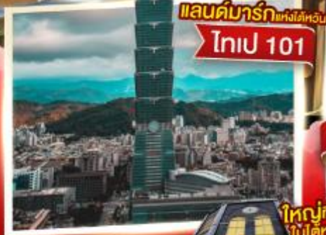
แลนด์มาร์กแห่งไต้หวัน ไทเป 101