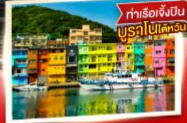
ทำเรือเจ็ปปิน บูราโนไปไต้หวัน