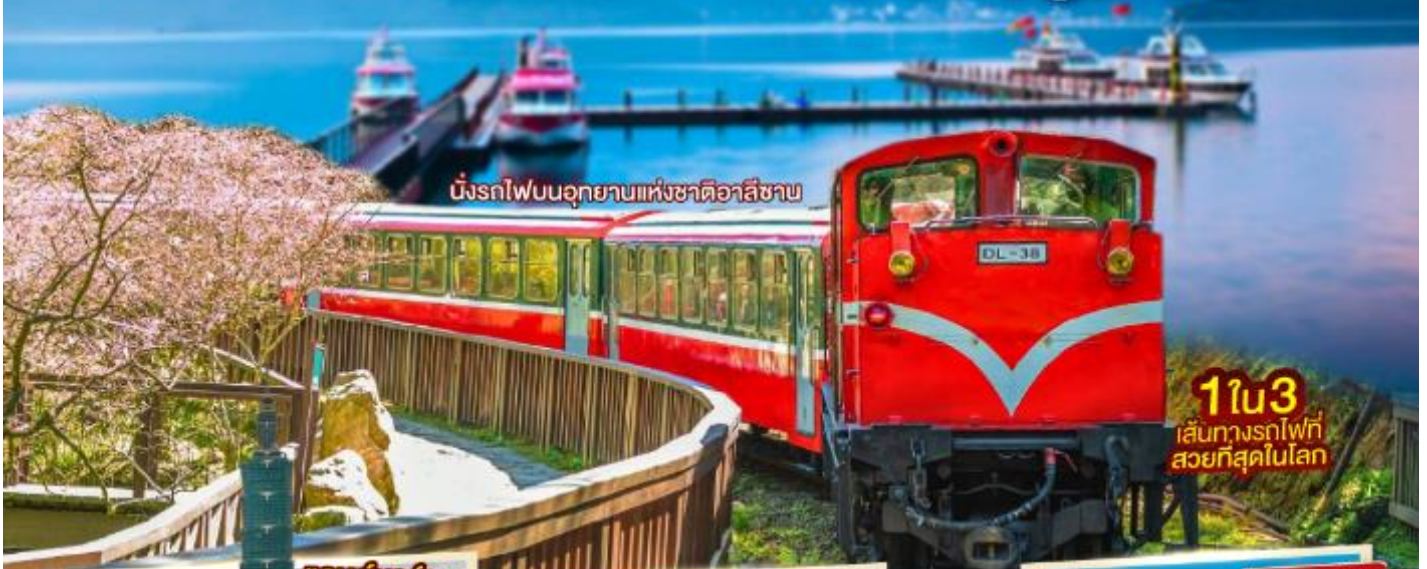
นั่งรถไฟบนอุทยานแห่งชาติอาลีซาน

ประกันอุบัติเหตุและอุบัติเหตุ คุ้มครองสูงสุด 3,000,000 บาท