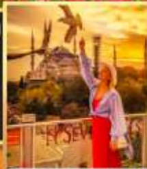
ลูปทีอปปาเซเวนฮิลล์ส