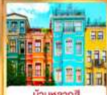
บ้านหลากสี คิสเลอร์ฟู