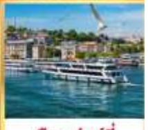
เรือเฟอร์รี่

เที่ยวครบเส้นทางยอดนิยม บินเข้าถึงเย็น เข้าชมสุเหร่ายักษ์คามลิก้า และล่องเรือเฟอร์รี่ ชมเทศกาลทิวลิปแห่งนครฮิสตันบูล