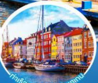
ท่าเรือฮาวน์.โตปเปอเทม