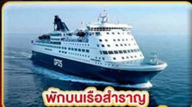
พักผ่อนเรือสำราญ แบบ Window Room 2 คืน