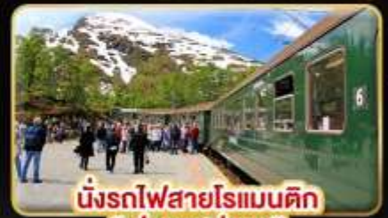
นั่งรถไฟสายโรแมนติก “ฟรอมสปาน่า”