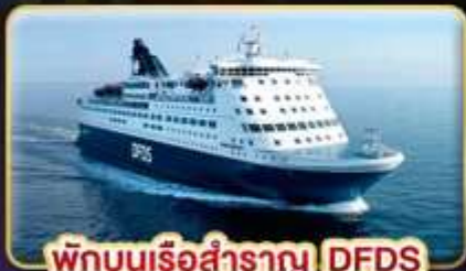
พักผ่อนเรือสำราญ DFDS