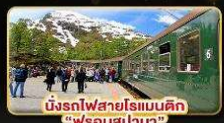
นั่งรถไฟสายโรแมนติก "ฟรอมสปาน่า"