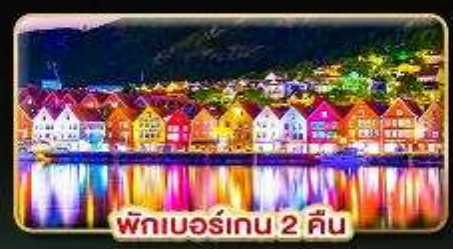
พักเบอร์เกน 2 คืน