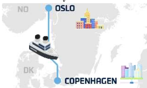
พิเศษ มื้อค่ำ DFDS Buffet Scandinavia