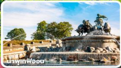
น้ำพุสี่ม้า

เรือสำราญบานุกทึยและรถไฟสายโรแมนติก สวีเดน นอร์เวย์ เดนมาร์ก 8 วัน 5 คืน