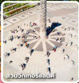
สวนวิกทอร์แลนด์