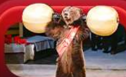
ชมละครสัตว์

สองเมืองไฮไลท์ของรัสเซียที่ไม่ควรพลาด! ดันต่าตื่นใจกับมหาวีหารเซนต์บาซิล ชมความยิ่งใหญ่ของจัตุรัสแดง สัมผัสอดีตที่พระราชวังเครมลิน ชมความงามของสถานีรถไฟใต้ดินมอสโก ซาครัส โบสถ์โกลีทซ์นิตส์ เนินเขาสเปร์โร ชมความงามพระราชวังฤดูหนาว พิธีกรีกเกอร์มิกอ ซมละครสตีว (Circus Show) ป้อมปีเตอร์แอนด์ปอล และมหาวีหารเซนต์ไอแซค