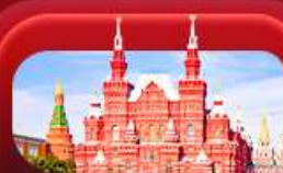
จัตุรัสแดง