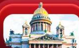
มหาวิหารเซนต์ไอแซค