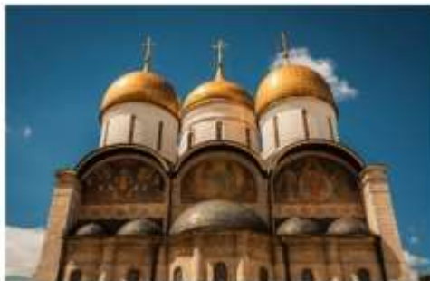
โบสถ์อัสสัมชัญ