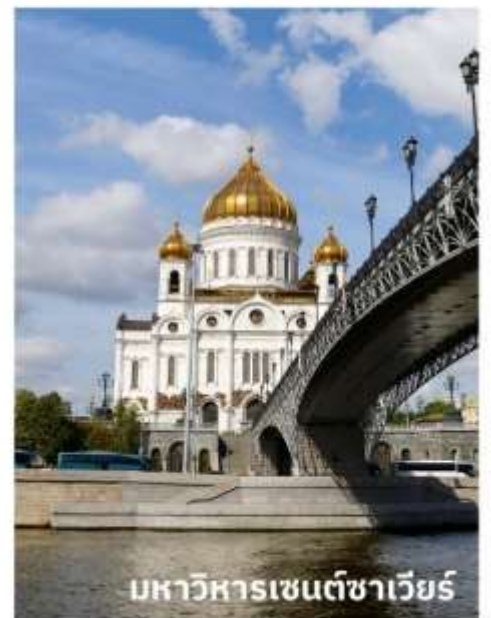
มหาวิหารเซนต์ซาเวียร์