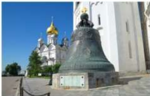
ระบั้งพระเจ้าซาร์

สร้างในสมัยพระนางแอนนาที่ทรงประสงค์จะสร้างระบั้งใบใหญ่ที่สุดในโลกเพื่อนำไปติดตั้งบนหอรบั้ง แต่เนื่องจากมีความผิดพลาดจึงทำให้ระบั้งแตกออก