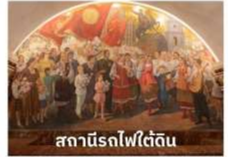
สถานีรถไฟใต้ดิน

เพราะนอกจากจะมีสถานีรถไฟใต้ดินที่สวยงามที่สุดในโลกแล้วยังมีความลึกมากอีกด้วย รถไฟใต้ดินทำให้ผู้คนสามารถเดินทางไปไหนมาไหนได้สะดวกกว่าบนถนนทั่วไป สถานีรถไฟใต้ดินเป็นสิ่งก่อสร้างที่ชาวรัสเซียสามารถอวดชาวต่างชาติให้เห็นถึงความยิ่งใหญ่ ตลอดจนประวัติศาสตร์ความเป็นชาตินิยมและวัฒนธรรมประเพณีอันสวยงาม เป็นเสน่ห์ดึงดูดให้นักท่องเที่ยวมาเยี่ยมชมเนื่องจากการตกแต่งของแต่ละสถานี มีความแตกต่างกันด้วยประติมากรรม โคมไฟระย้า เครื่องแก้ว หินแกรนิต และหินอ่อน เป็นต้น