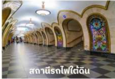
สถานีรถไฟใต้ดิน

บริการอาหารเช้า ณ ห้องอาหารของโรงแรม นำท่านเที่ยวชม สถานีรถไฟใต้ดิน ที่ใครมามอสโกจะต้องได้ลองนั่งรถไฟใต้ดินดูสักครั้ง