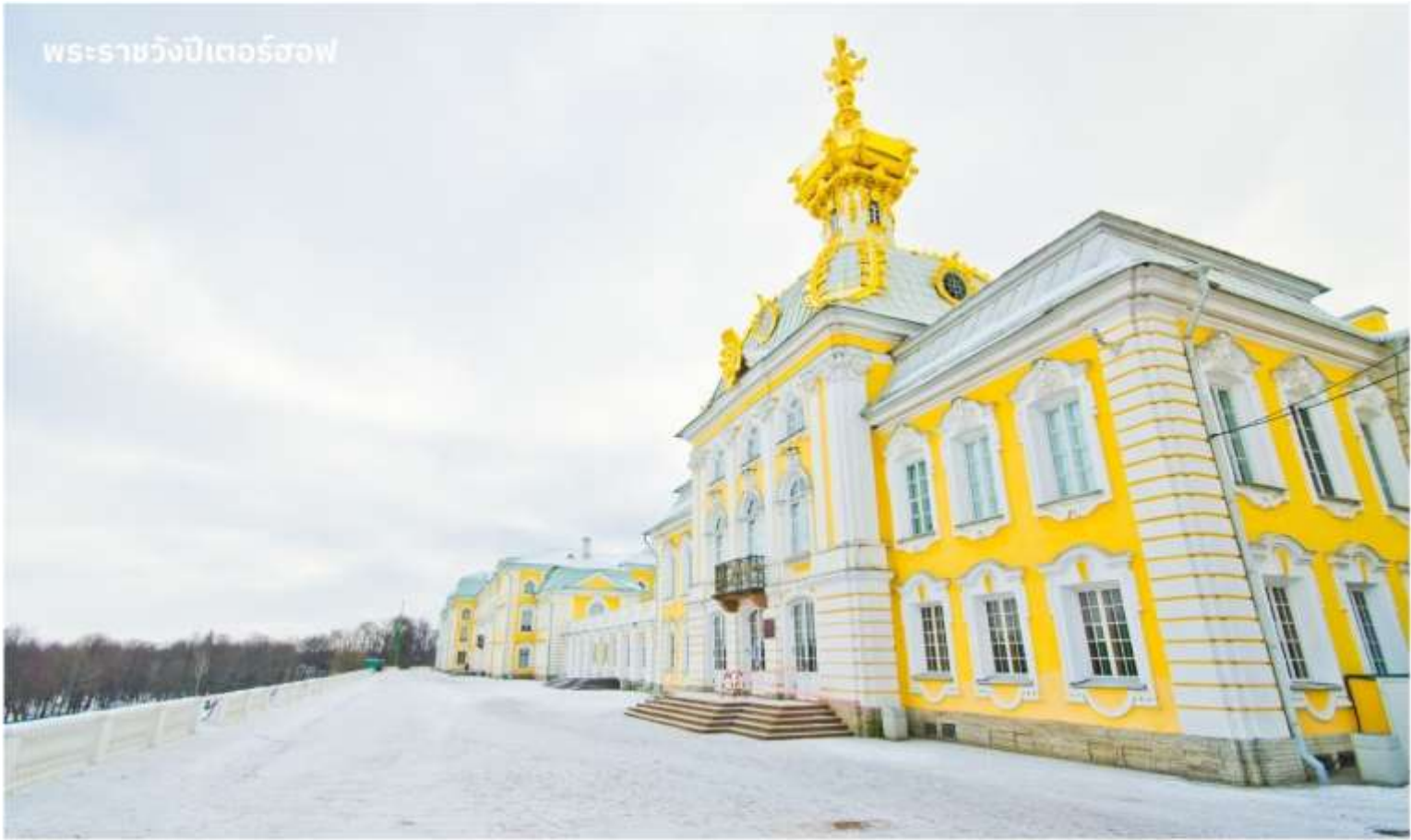
พระราชวังปีเตอร์ฮอฟ