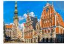
เมืองริกา

** พักที่ Bellevue Park Hotel Riga 4* หรือเทียบเท่า **