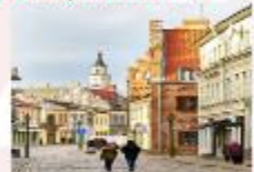
Kaunas Old Town

** พักที่ Holiday Inn Vilnius Hotel 4* หรือเทียบเท่า **