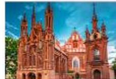
โบสถ์เซนต์แอน