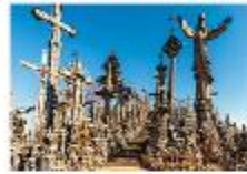
Hill of Crosses