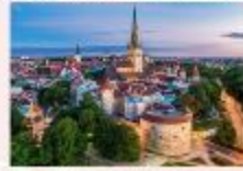
Tallinn Old Town