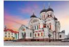
โบสถ์อเล็กซานเดอร์ เนฟสกี

19.35 น. ออกเดินทางสู่อิสตันบูล เที่ยวบิน TK1424