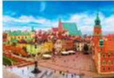
จัตุรัสเมืองเก่า