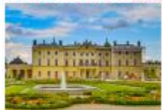
พระราชวัง Branicki