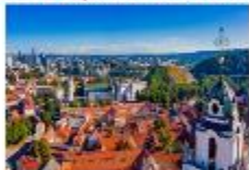
Vilnius Old Town