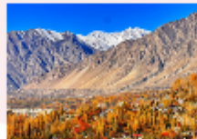
หุบเขาพาสสุ