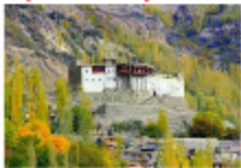
บ้อมบัลดิท