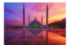
มัสยิดไฟซาล