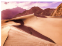
ทะเลทรายคัทปานา