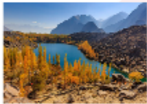
ล่องเรือชมความงาม ทะเลสาบคาปูรา