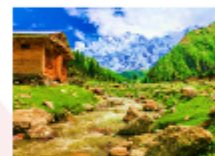
ยอดเขานังกาพาร์บัด