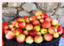
สวนผลไม้ตามฤดูกาล