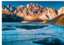
สะพานแขวนอุสโซนิ