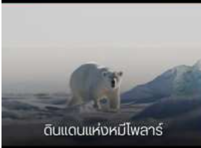
ดินแดนแห่งหมีโพลาร์