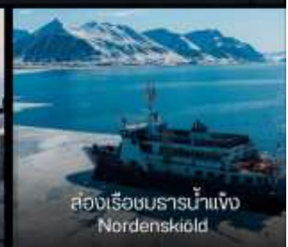
สองเรือชมธารน้ำแข็ง Nordenskiöld