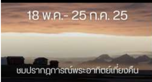
ชมปรากฏการณ์พระอาทิตย์เที่ยงคืน