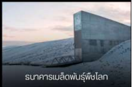
ธนาคารเมล็ดพันธุ์พืชโลก