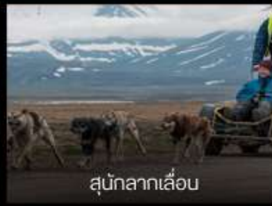
สุนัขลากเลื่อน