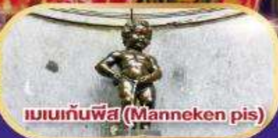
แมนเนกันพีส (Manneken pis)