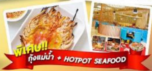
พิเศษ!! กุ้งแม่น้ำ + HOTPOT SEAFOOD