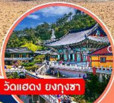
วัดแฮดง ยงกุงซา