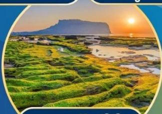
พาดคังซึงกี