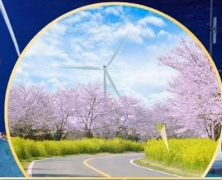
ซากุระ / ทุ่งดอกเรป