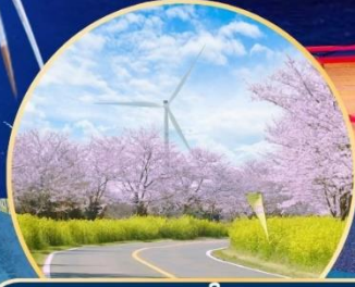
ซากุระ / ทุ่งดอกเรป