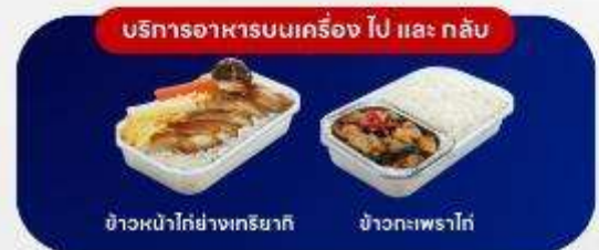
ข้าวหน้าไก่ย่างทรียากิ