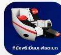
ที่นั่งพรีเมียมเฟลตเบด