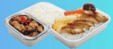
บริการอาหารร้อนบนเครื่อง ขาไป - ขากลับ