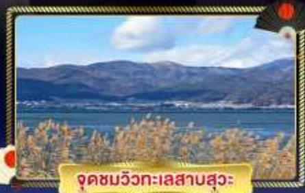
จุดชมวิวกะเลสาบสุมะ