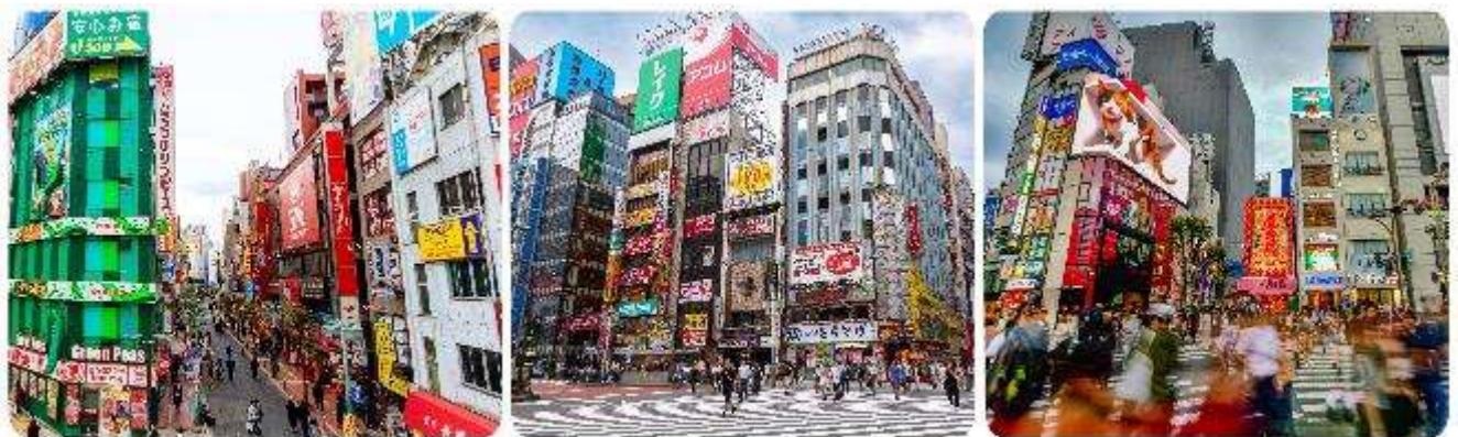
ช้อปปิ้งใจกลางกรุงโตเกียว - ชินจูกุ

มื้อกลางวัน บริการท่านด้วย ชุดอาหารญี่ปุ่นเบนโตะ