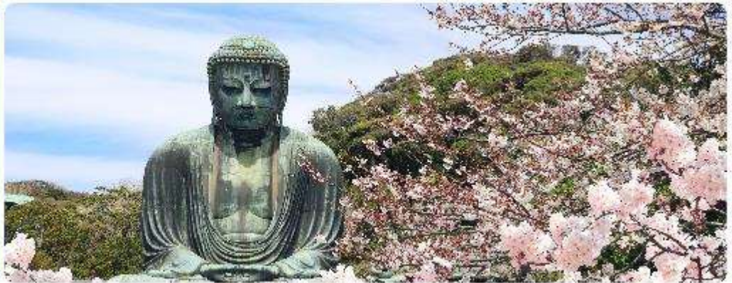
พระใหญ่ไดบุทสึ วัดโคโตคุอิน

จุดเด่นแห่งเมืองนี้คือ พระพุทธรูปองค์ใหญ่ไดบุทสึ (Daibutsu) หนึ่งในสัญลักษณ์ที่โดดเด่นที่สุดของ Kamakura พระพุทธรูปบรอนซ์ขนาดมหึมาที่วัดโคโตคุอิน (Kotoku-in) ที่มีความสูง 13.35 เมตร หนึ่งในพระพุทธรูปที่ใหญ่ที่สุดในญี่ปุ่น ไฮไลท์ของที่นี่คือการได้ชมความงดงามที่ตัดกันระหว่างพระพุทธรูปไดบุทสึขนาดใหญ่และต้นซากุระ ซึ่งปลูกอยู่ทั้งด้านหน้าและด้านหลังของพระพุทธรูป ทำให้เหมาะอย่างยิ่งกับการเดินเล่นและชมซากุระในบริเวณวัด เป็นอีกหนึ่งสถานที่ที่ต้องมาเยือนสักครั้ง หนึ่งในจุดไฮไลท์ของเมืองคามาคุระคือ ไม่น่าใกล้กันพาเยือน เกาะเอโนชิมะ (Enoshima) เป็นเกาะที่ตั้งอยู่ในจังหวัดคานากาวะ ประเทศญี่ปุ่น ซึ่งเป็นจุดหมายท่องเที่ยวยอดนิยมที่มีทิวทัศน์สวยงามและสถานที่ที่น่าสนใจมากมาย ทั้งชายหาดสวย และวิวทะเลที่งดงาม ในวันที่ท้องฟ้าโปร่งใสเรายังสามารถมองเห็นวิวของภูเขาไฟฟูจิได้อีกด้วย ด้านบนยังมี ศาลเจ้าเอโนชิมะ ที่มีความสำคัญในด้านความโชคดี โดยเฉพาะในเรื่องความรัก นอกจากนี้ยังมี หอคอยประภาคารเอโนชิมะ ที่ให้ทัศนียภาพ 360 องศา ของเมืองคามาคุระได้อีกด้วย