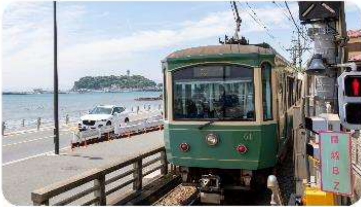
เมืองคามาคุระ