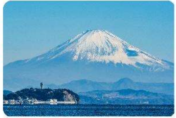
เกาะเอโนะชิมะ

เมืองคามาคุระ (Kamakura) เมืองน่ารักติดทะเล ตอบโจทย์ที่เที่ยวที่ผสมผสานระหว่างประวัติศาสตร์ ธรรมชาติ และความงามของทะเล บอกเลยใครมาต้องตกหลุมรักกับเมืองสุดชิล อย่าง คามาคุระ เมืองเล็กๆ ที่ตั้งอยู่ทางตอนใต้ของจังหวัดคานากาวะ ห่างจากโตเกียวเพียงแค่ 1 ชั่วโมง เท่านั้น แต่เต็มไปด้วยสถานที่ท่องเที่ยว ทิวทัศน์ธรรมชาติ และชายหาดที่งดงาม ที่นี้จะทำให้ทุกคนรู้สึกเหมือนได้ย้อนกลับไปสัมผัสประวัติศาสตร์ญี่ปุ่นในยุคซามูไร พร้อมทั้งได้ผ่อนคลายท่ามกลางบรรยากาศที่เงียบสงบและสดชื่น