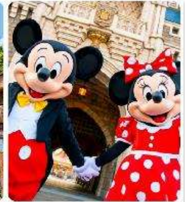
โตเกียวดิสนีย์แลนด์

แนะนำที่เที่ยว อิสระด้วยตัวเองเต็มวัน ! เลือกซื้อทัวร์เสริมอิสระดิสนีย์แลนด์ (ไม่มีหัวหน้าทัวร์และไม่มีไกด์นำเที่ยว) เอาใจแฟนพันธุ์แท้ของดิสนีย์ กับ สวนสนุกโตเกียวดิสนีย์แลนด์ ที่เต็มไปด้วยการผจญภัย ความสนุกสนานในโลกลึกลับเมื่อก้าวเข้าสู่ สวนสนุกโตเกียวดิสนีย์แลนด์ จะพบกับธีมพาร์คที่ แบ่งออกเป็น หลากหลาย เช่น Adventureland ที่เต็มไปด้วยการผจญภัยในป่าและน้ำตก, Fantasyland ดินแดนของตัวละครดิสนีย์ที่คุณหลงใหล, และ Tomorrowland ที่จะพาคุณไปสำรวจอนาคตที่เต็มไปด้วยนวัตกรรม และเปิดประสบการณ์ใหม่ที่ Tokyo Disney Sea ที่จะพาคุณไปผจญภัยยังโลกทะเลและการผจญภัยทางน้ำ นอกจากนี้เรายังเพลิดเพลินกับร้านอาหารและคาเฟ่รวมไปถึงของฝากจากดิสนีย์อีกมาย (ค่าทัวร์ยังไม่รวมบัตรค่าเข้า)