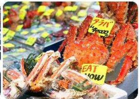
ตลาดปลาซึกิจิ

แนะนำที่เกี่ยว อิสระด้วยตัวเอง - ตลาดปลาซึกิจิ Tsukiji Outer Market ตลาดปลาชื่อมีชื่อเสียงของญี่ปุ่น และยังเป็นหนึ่งในตลาดปลาที่ใหญ่ที่สุดในโลกด้วยค่ะ ตั้งอยู่ในโตเกียว ตลาดแห่งนี้มีการซื้อขายอาหารทะเลมากกว่า 2,000 ตันต่อวัน โดยโซนภายในตลาดนั้นจะแบ่งออกเป็น 2 ส่วน ก็คือ ส่วนด้านนอก ที่มีร้านค้าปลีกและร้านอาหารอยู่เรียงรายให้เราได้เลือกซื้ออาหารทะเลสดๆ รับประทานกัน