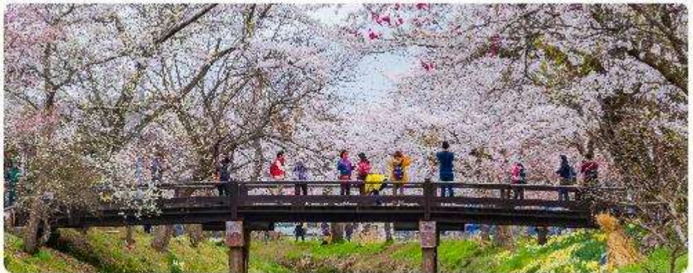
หมู่บ้านน้ำใสโอชิโนะ อักโก

โอชิโนะ อักโก หรือ ที่รู้จักกันในชื่อ หมู่บ้านน้ำใส ความงามแห่งธรรมชาติและวัฒนธรรมที่ ซ่อนอยู่ใต้เงากุเขาไฟฟูจิโอชิโนะ อักโก ตั้งอยู่ในหมู่บ้านโอชิโนะ จังหวัดยามานาชิ ประเทศญี่ปุ่น เป็นแหล่งน้ำธรรมชาติที่มีชื่อเสียง ประกอบด้วยบ่อน้ำใสสะอาดทั้งแปดแห่ง ซึ่งน้ำในบ่อเหล่านี้เกิด จากการละลายของหิมะและน้ำแข็งจากกุเขาไฟฟูจิ น้ำที่ไหลลงมานั้นได้ถูกกรองผ่านชั้นหินกุเขาไฟ