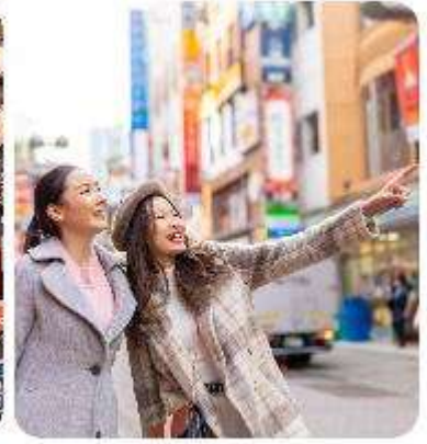
ช้อปปิ้งใจกลางกรุงโตเกียว