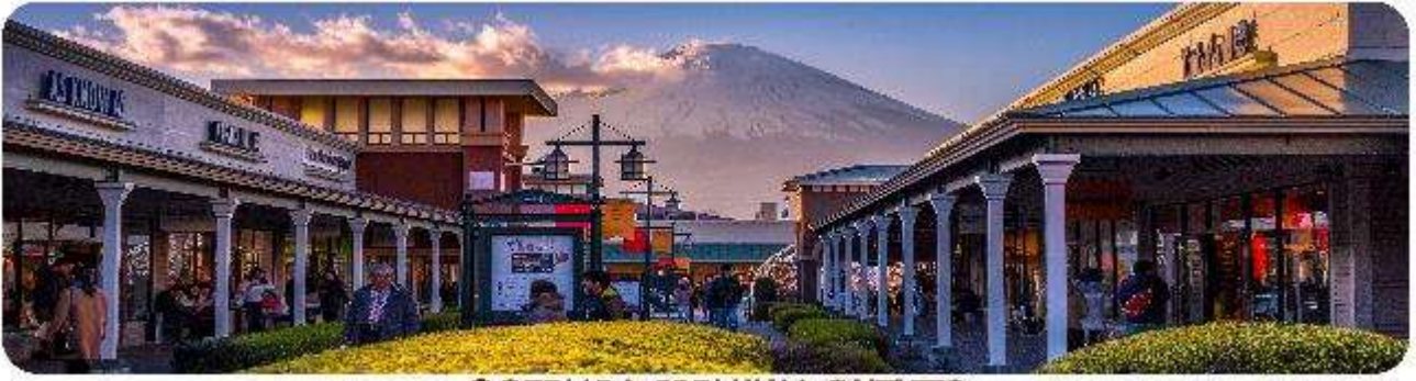
GOTEMBA PREMIUM OUTLETS

จากนั้นพาทุกท่านสู่... Gotemba Premium Outlets ห้างเอาท์เล็ตที่มีขนาดใหญ่ที่สุดในญี่ปุ่น ตั้งอยู่ที่ ฮาโกเน่ จังหวัดคานากาวา ของประเทศญี่ปุ่น เป็นแหล่งช้อปปิ้งที่มีทั้ง แบรินต์ในประเทศและแบรินต์ต่างประเทศ ถ้าอยากหาของอะไรให้มาที่นี่ได้เลย อีกทั้งในบริเวณนี้ ยังเป็นทางผ่านไปเที่ยว ภูเขาไฟฟูจิ และทะเลสาบฮาโกเน่ อีกด้วย และยังสามารถมองเห็นภูเขาไฟฟูจิได้จากตรงนี้แบบชัด ๆ ไปเลย คือเดินช้อปปิ้งเราก็จะเห็นจุดพิกัดเอาไว้ชมวิวิวฟูจิสวย ๆ ไปด้วย เป็นอีกสถานที่ที่อยากให้สายเที่ยว สายช้อปปิ้งได้มาชมวิวิวและละลายทรัพย์กันอย่างมาจริง ๆ