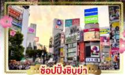
ช้อปปิ้งชิบูย่า