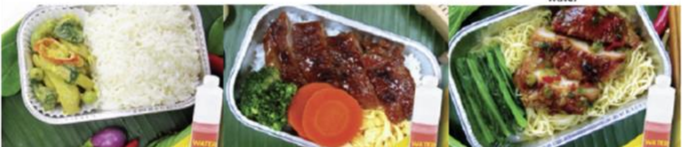
Chicken roasted with herb and noodle and water