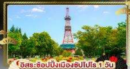
อิสระ-ช้อปปิ้งเมืองซัปโปโร 1 วัน