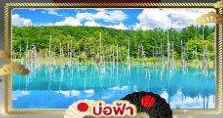
บ่อน้ำพุร้อน