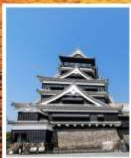
ปราสาทคุมาโมโตะ