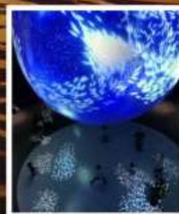
พิพิธภัณฑ์สัตว์น้ำนิเพส