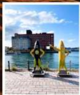
โมจิโกะทาวน์