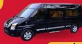
VAN (7-8 ท่าน)