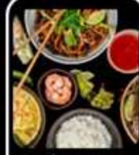
มือพิเศษ