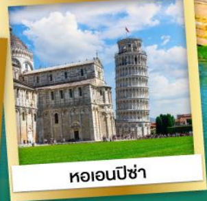
หออนปีซ่า