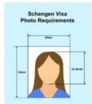
ตัวอย่างรูปถ่าย