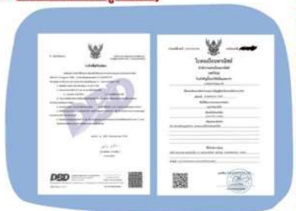
ตัวอย่างหนังสือจดทะเบียนบริษัทฯ และ ใบทะเบียนพาณิชย์