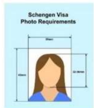
ตัวอย่างรูปถ่าย