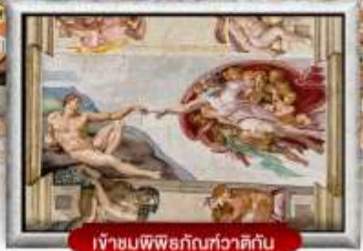
เข้าชมพิพิธภัณฑ์วาติกัน

เมนูพิเศษ! สปาเกตตี้เส้นหมึกดำ, พิชซ่าสไตล์อิตาลีเย็นแท้