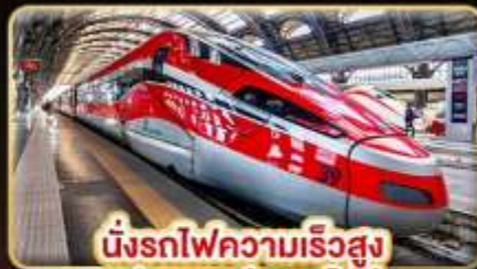
นั่งรถไฟความเร็วสูง ฟลอเรนซ์ - นาโปลี