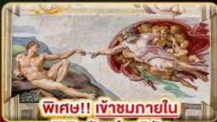
พิเศษ!! เข้าชมภายใน พิพิธภัณฑ์วาติกัน