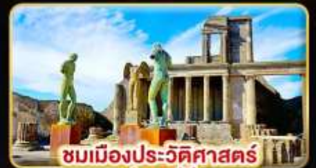
ชมเมืองประวัติศาสตร์ ปอมเปอี