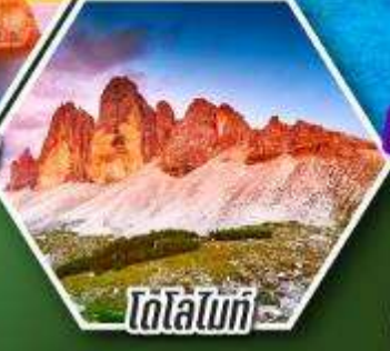
โตโลไมท์

โปรแกรมพิเศษ เก็บครบรอบ อิตาลี ตั้งแต่เหนือถึงใต้