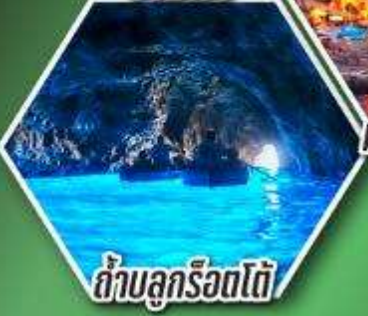
ถ้ำลูกรोटโต้