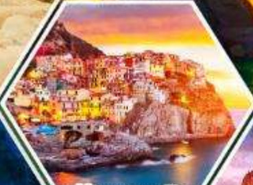
หมู่บ้านมาราโรลา