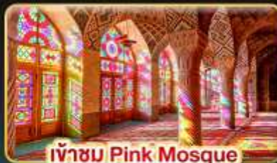
เข้าชม Pink Mosque