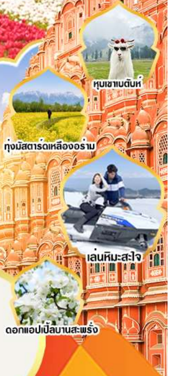
หุบเขาบตันห์