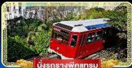
นิงรรางพิกแถม

🇧🇪 นิงกระเซ่านองปิง 360 องศา บินลัดฟ้าไปมู..สู่เกาะฮ่องกง