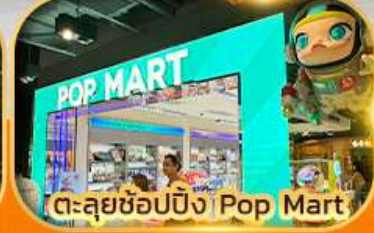
ตะลุยช้อปปิ้ง Ping Pop Mart