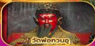
วัดพ่อกวนจู