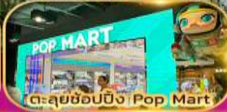
ตะลุยช้อปปิ้ง Pop Mart