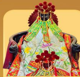
เจ้าแม่กวนอิมสองขำ