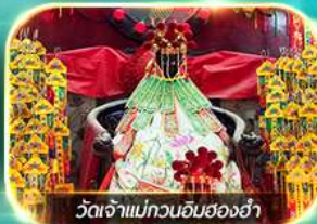
วัดเจ้าแม่ทวนอิมฮ่องกง