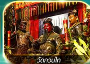
วัดกวนโท

ไหว้ 8 เซียนวัดดั่ง ปิงไม่หยุด ครบถ้วน!! การเงิน การงาน ความรัก และสุขภาพ