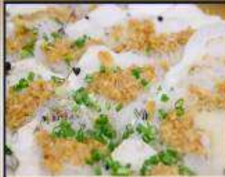
หอยเชลล์อบวุ้นเส้น