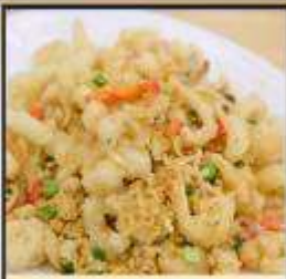
หมึกทอดกระเทียม