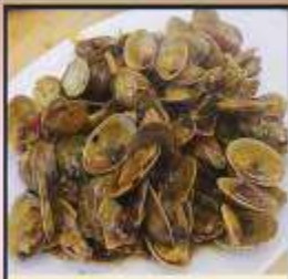
ผัดหอยลาย