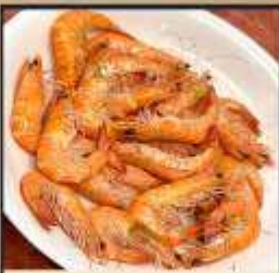
กุ้งหวานลวก