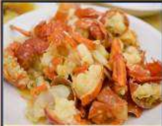
กุ้งมังกรอบซีส