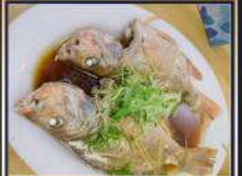
ปลาหนึ่งซีอิ๊ว