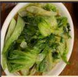
ผัดผักตามฤดูกาล