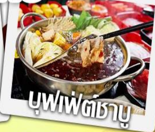
บุฟเฟ่ต์ชาบู