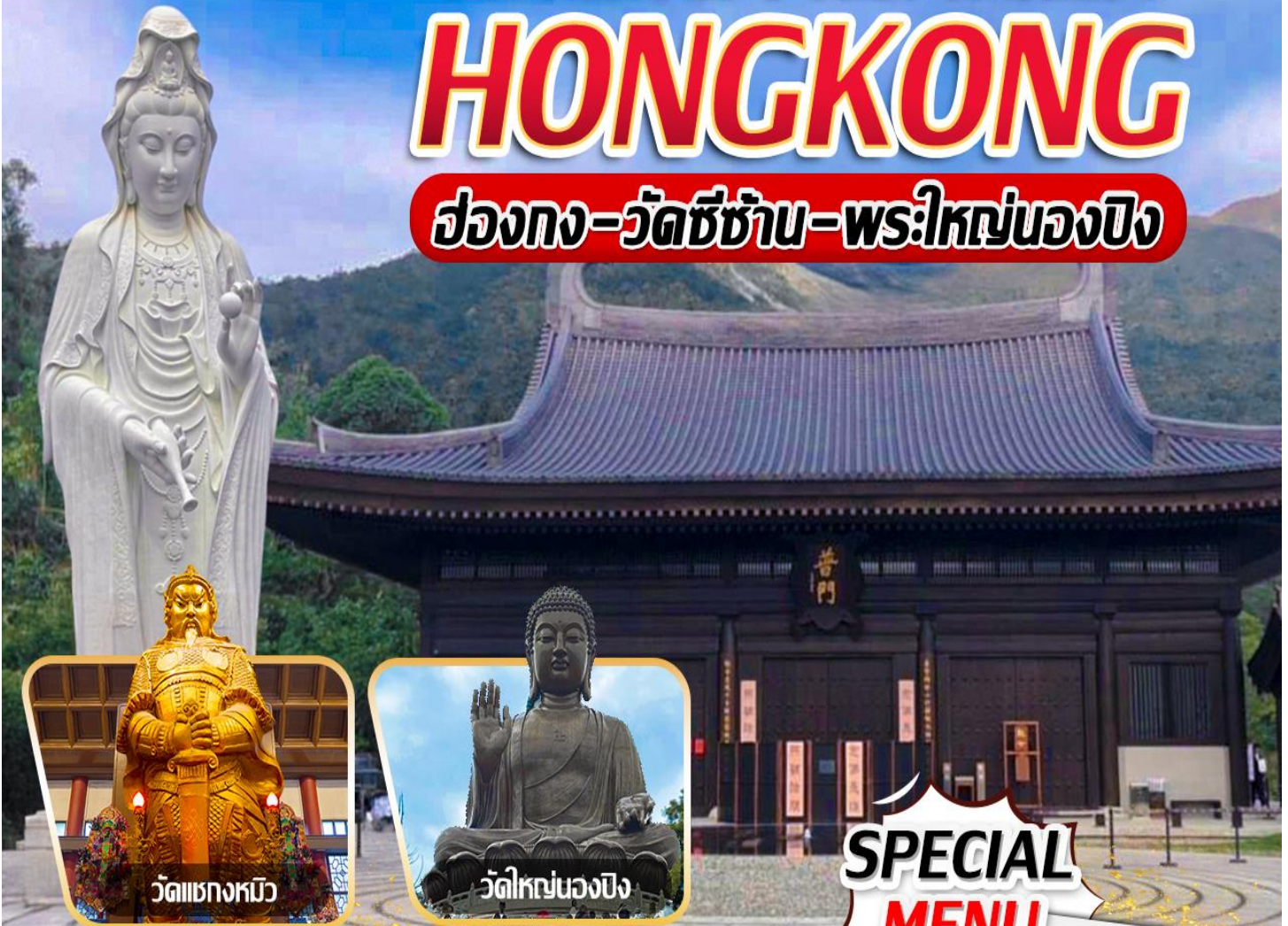
วัดเขangkงหวี