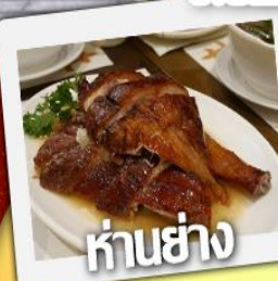
ก้านย่าง