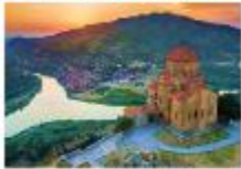
อารามจวารี