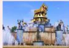
เมืองคูทซี

** พักที่ Kutaisi Inn Hotel หรือเทียบเท่า **