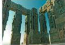
CHRONICLE OF GEORGIA

** พักที่ Clock Town Hotel หรือเทียบเท่า **