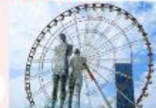
รูปปั้นอาลีและนีโน