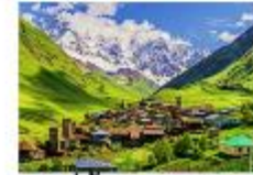
หมู่บ้าน Ushguli

** พักที่ Best Western Hotel หรือเทียบเท่า **