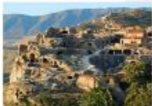
เมืองอุพลิสซิเค