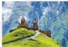
Gergeti sameba church

** พักที่ Intourist Kazbegi Hotel หรือเทียบเท่า **