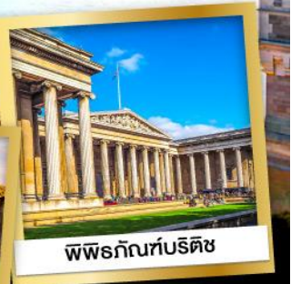
พิพิธภัณฑ์บริติช