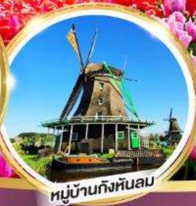
หมู่บ้านกังหันลม