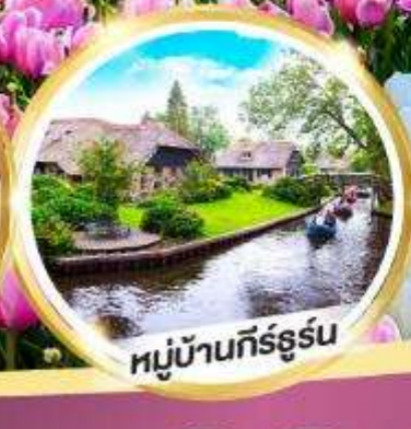
หมู่บ้านกิร์ธูร์น