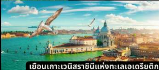
เยือนเกาะเวนิสราชนิแห่งทะเลเอเดรียติก