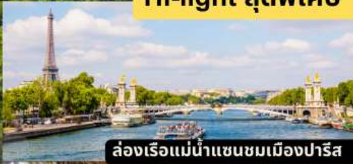
ล่องเรือแม่น้ำแซนชมเมืองปารีส